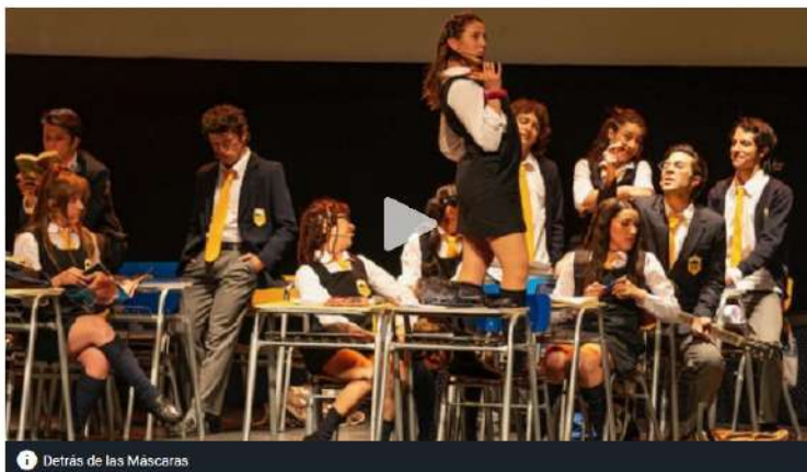
Detrás de las Máscaras